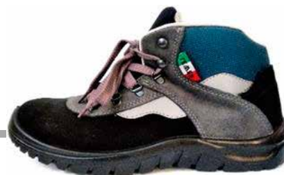
SCARPA SCAMOSCIATA ALTA S3