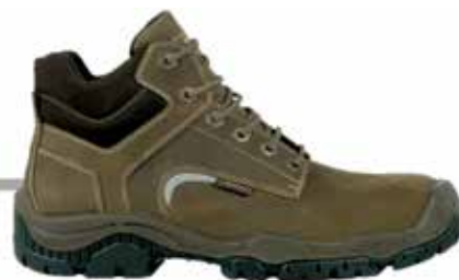
SCARPA PELLE ALTA S3