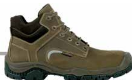
SCARPA PELLE ALTA S3