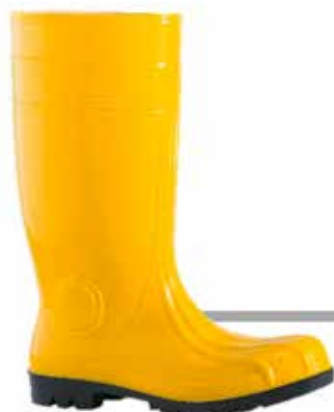
STIVALE IN GOMMA S5