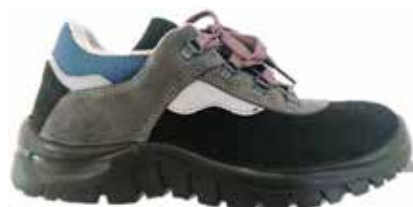
SCARPA SCAMOSCIATA BASSA S3