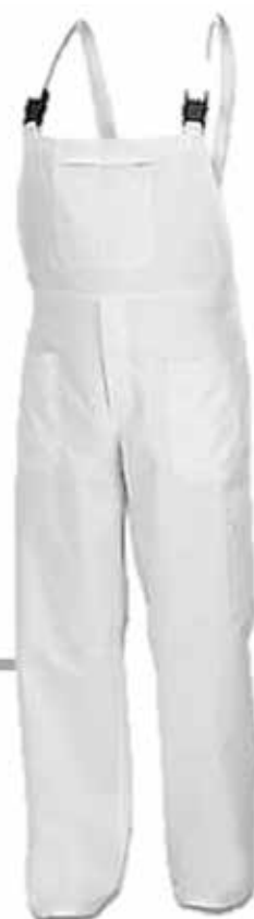
SALOPETTE BIANCA INVERNALE