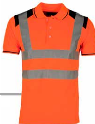
POLO ALTA VISIBILITA'