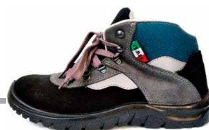
SCARPA SCAMOSCIATA ALTA S3