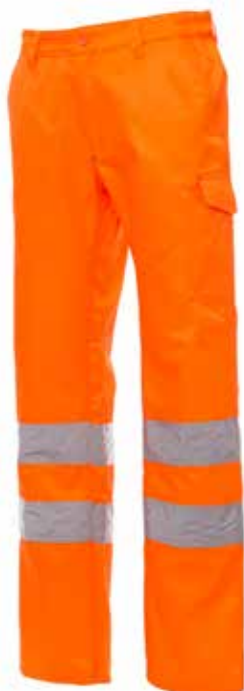
PANTALONI ALTA VISIBILITA'