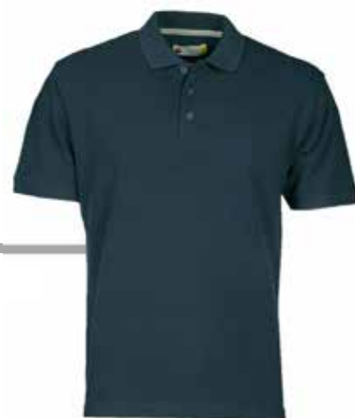
POLO MANICA CORTA