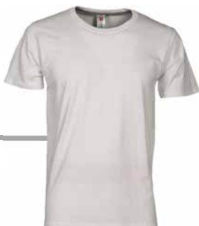
T-SHIRT MANICA CORTA