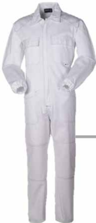
TUTA BIANCA INVERNALE