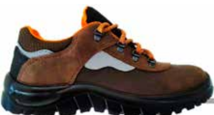
SCARPA PELLE NABUK BASSA S3