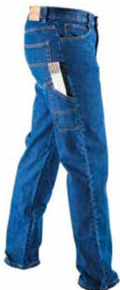
JEANS CON PORTA METRO