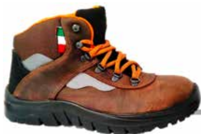
SCARPA PELLE NABUK ALTA S3