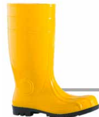
STIVALE IN GOMMA S5