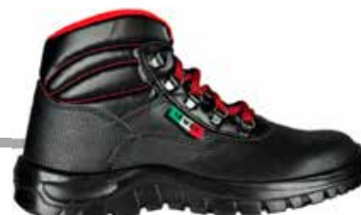
SCARPA ASFALISTI HRO